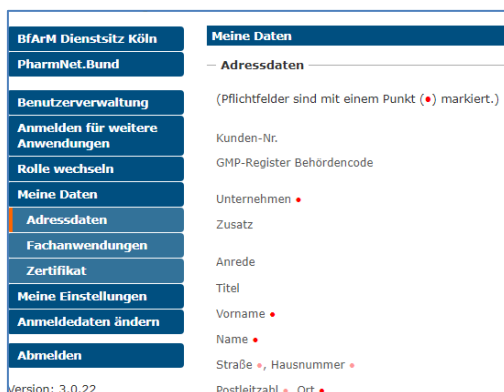
Abbildung 2 Adressdaten

Im Bereich „Meine Daten“ können eigene Daten wie Post-Adresse, E-Mail-Adresse oder Passwort geändert und, falls nötig, ein Zertifikat erstmalig hochgeladen oder erneuert werden (diese Funktion ist für den Zugriff auf das GMP-Register nicht relevant).